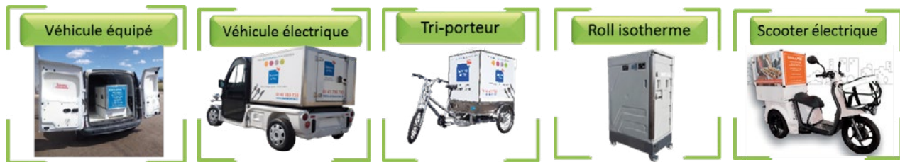
Figure 2 : éventails des applications potentielles ou encore des véhicules équipés de systèmes fixes.

C'est aujourd'hui le seul système de réfrigération fonctionnant de manière parfaitement autonome sans aide externe de batterie électrique ni compresseur.